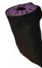
Basurero de tela