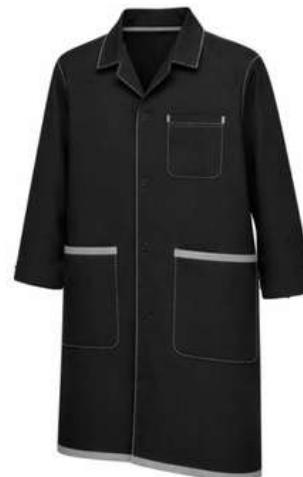
Mandiles Protección ligera