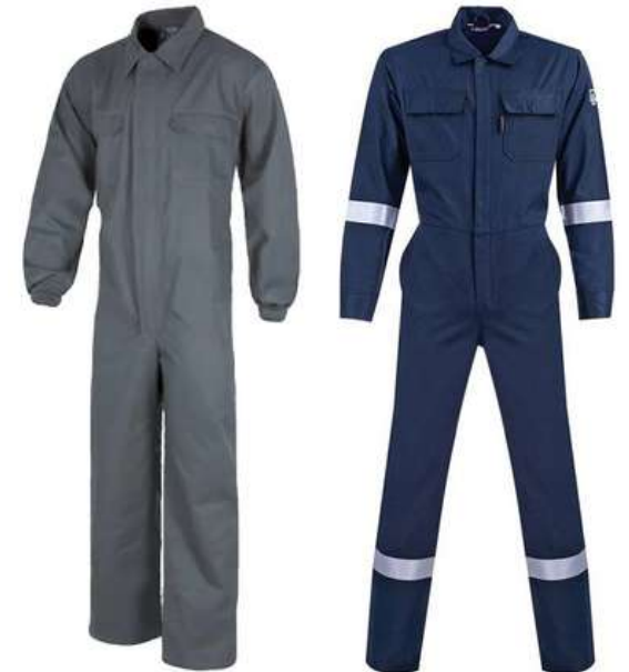
Overol industrial Alta resistencia