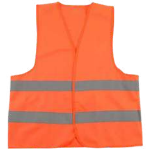
Reflexivo Alta visibilidad