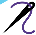
Imagen premium, alta durabilidad. Acabado elegante y resistente, ideal para uniformes corporativos y prendas de uso frecuente.