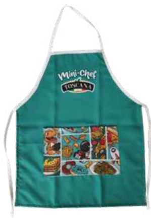
Sublimados Alta visibilidad