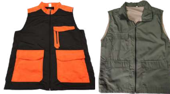
Outdoor Uso operativo