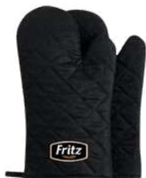
Guantes Campaña masiva