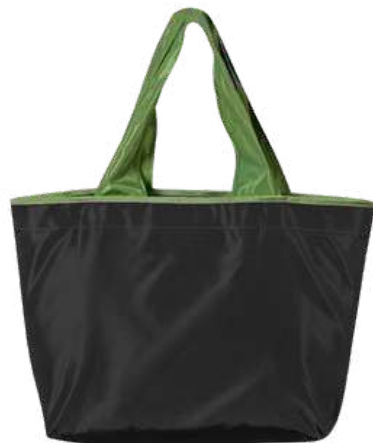
Bolso de tela