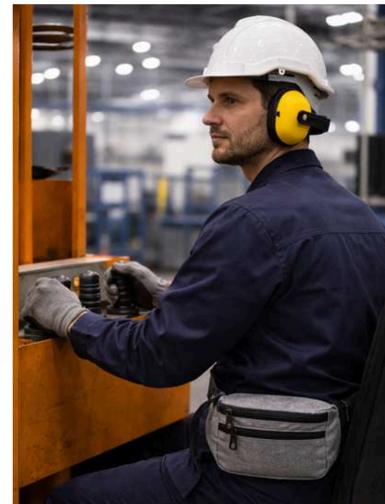
Industrial Uso Industrial Paramédico

Contamos con una amplia variedad de modelos. Consulta con nuestro equipo para ver más opciones.