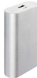
Power Bank Promocional