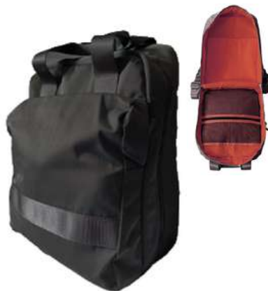
Mochilas livianas Premium