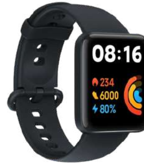
Smart Watch Corporativo