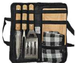
Kit parrillero Premium

La opción ideal para campañas de alto impacto