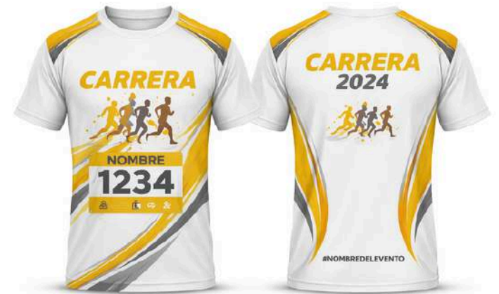
Camiseta sublimada Alta visibilidad