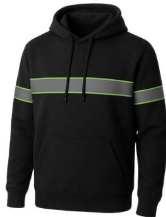
Hoodie Clima frío