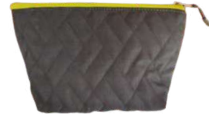
Acolchado Alta visibilidad