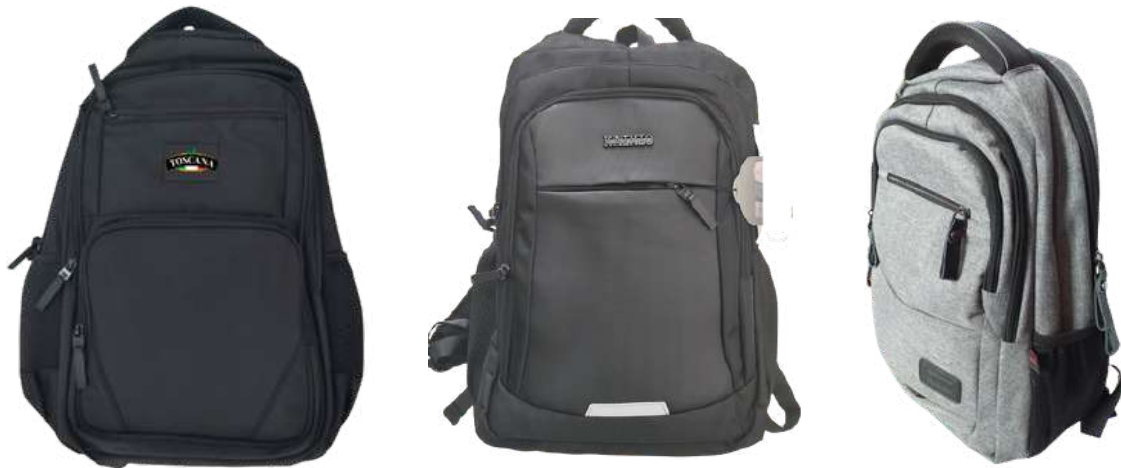
Mochilas importadas Corporativo

Marca la diferencia con accesorios corporativos pensados para el día a día