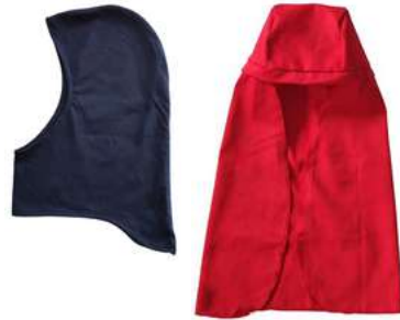
Estibador Uso operativo