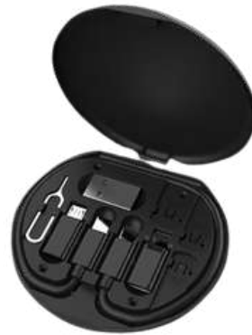
Kit multicarga Promocional