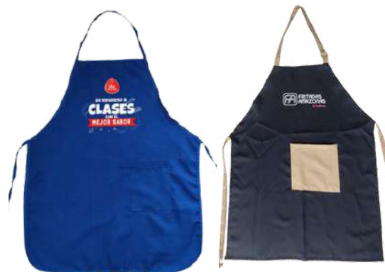
Promocionales Campaña masiva