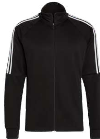
Buzos Uso deportivo