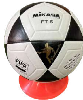
Balones Uso recreativo