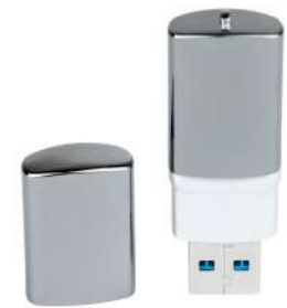
Flash Memory Promocional