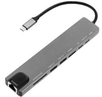
Hub USB C Corporativo