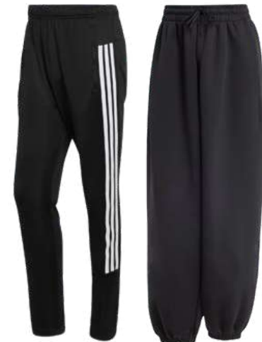
Pantalón Uso deportivo